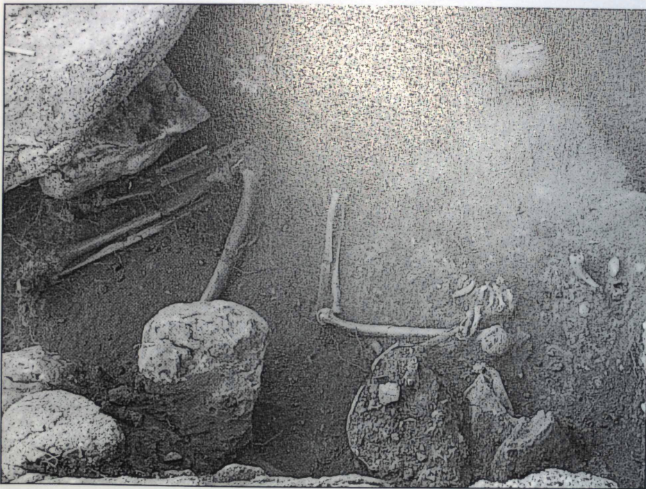
El dolmen de Roca Sereny en procés d'excavació.

una mica, i que com que havia esperat uns milers d'anys, ara tampoc no venia d'aquí. Naturalment, em vaig posar a la seva disposició per ensenyar-li el lloc, però no va mostrar gaire interès.