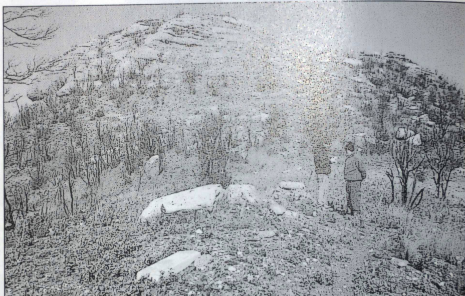
En el peu mateix del turó de Roca Sereny s'identifiquen les lloses del sepulcre megalític.